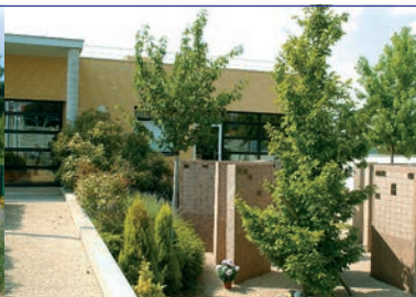
Crématorium du Val-de-Bièvre à Arcueil