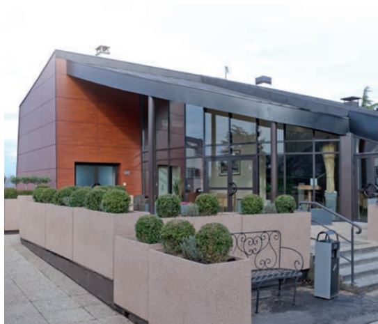
Chambre funéraire de Nanterre