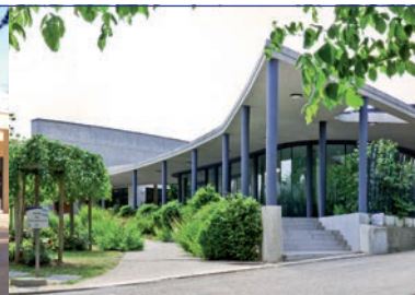
Crématorium de Champigny-sur-Marne