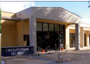
Crématorium du Parc à Clamart