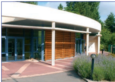
Crématorium du Mont-Valérien à Nanterre