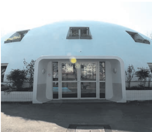
Chambre funéraire de Montreuil-sous-Bois